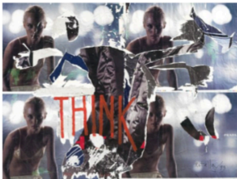
Mimmo Rotella, Think, 1999 ecologie e pitture, cm. 140x190

30 Marzo - 9 Giugno 2012, presso Galleria Tornabuoni Art, Parigi.