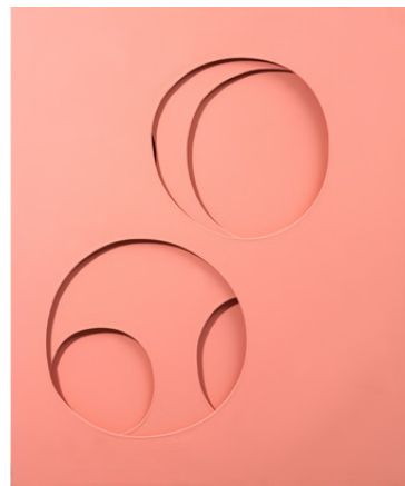
Paolo Scheggi, Intersuperficie curva dal rosa , 1967, Acrylique rose sur trois toiles superposées, cm 120 x 100 x 5 / in 46.2 x 39.4 x 2. Courtesy Tornabuoni Art © Paolo Scheggi / SIAE