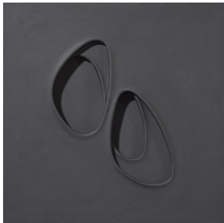
Paolo Scheggi, Zone riflesse , 1963, Acrylique noire sur trois toiles superposées, cm 60 x 60 x 6 / in 23.6 x 23.6 x 2.4. Courtesy Tornabuoni Art © Paolo Scheggi / SIAE