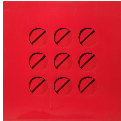
Paolo Scheggi, Intersuperficie curva. Tondi per quadri , 1967, Acrylique rouge sur trois toiles superposées, cm 70 x 70 x 5 / in 27.6 x 27.6 x 2. Courtesy Tornabuoni Art © Paolo Scheggi / SIAE

Galerie Tornabuoni Art 16 Avenue Matignon, Paris 75008 France Tél. +33 (0)1 53535151 info@tornabuoniart.fr www.tornabuoniart.fr Heures d'ouverture : Lundi-Samedi, de 10h30 à 18h30