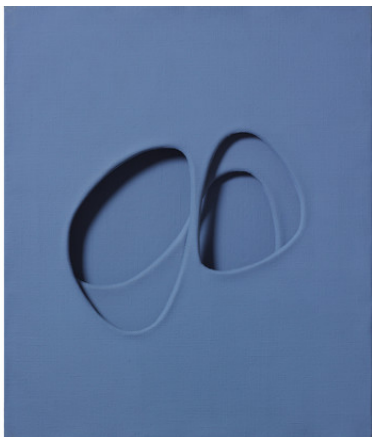
Paolo Scheggi, Zone riflesse , 1965, Acrylique bleue sur trois toiles superposées, cm 60 x 50 x 5.5 / in 23.6 x 19.7 x 2.2. Courtesy Tornabuoni Art © Paolo Scheggi / SIAE