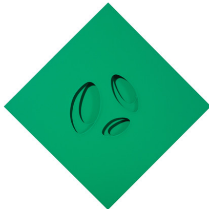
Paolo Scheggi, Intersuperficie curva verde , 1966, Acrylique verte sur trois toiles superposées, cm 80 x 80 x 6 / in 31.5 x 31.5 x 2.4. Courtesy Tornabuoni Art © Paolo Scheggi / SIAE