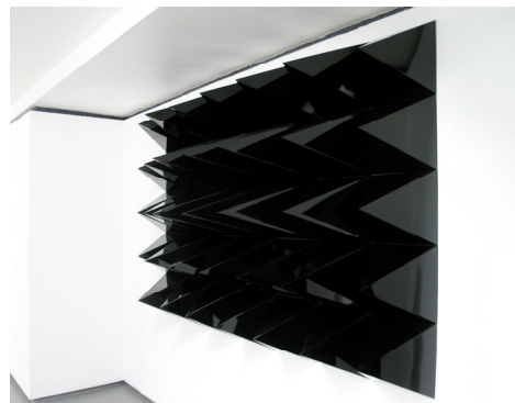
Laurent Grasso, Anechoic Wall , 2008.