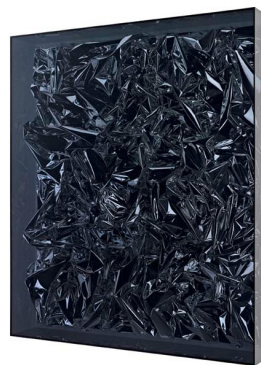
Anselm Reyle, Untitled , 2010.