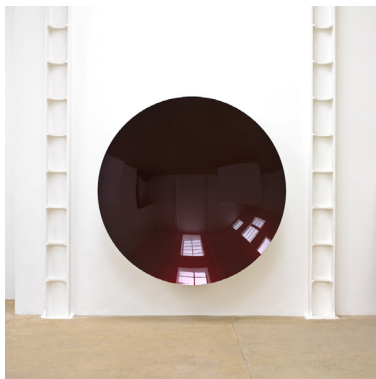
Anish Kapoor, Untitled , 2008. Coll. privée.