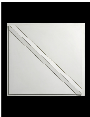
Luis Tomasello, Atmosphère chromoplastique n° 413 , 1976.