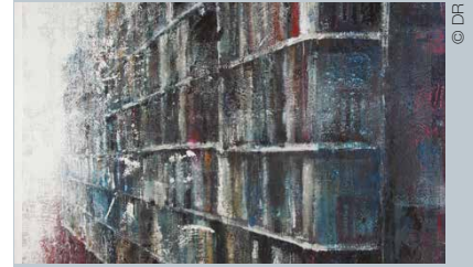
Philippe Cognée, Bibliothèque (détail), 2017.

JUSQU'AU 24 FÉVRIER – TORNUABONI ART PARIS PASSAGE DE RETZ, PARIS 3 e – WWW.TORNUABONIART.FR