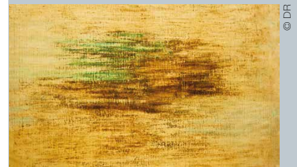
René Laubiès, sans titre, 1964, huile sur papier marouflée sur toile.

Galerie Univer Jusqu'au 3 mars 6 Cité de l'ameublement, Paris 11 e www.galerieuniver.com