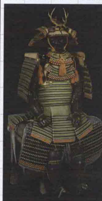
Armatura da samurai di Myochin Muneakira (1723).

Uno spazio speciale, il Tefaf Showcase, sarà dedicato alle più interessanti gallerie emergenti che potranno partecipare, almeno una volta, a questo imperdibile evento. Tra queste, la galleria milanese Giuseppe Piva (giuseppepiva.com), specializzata in arte giapponese, esporrà un'importante armatura da samurai di Myochin Muneakira del 1723, proveniente dalla Fondazione Kozi di Kyoto.