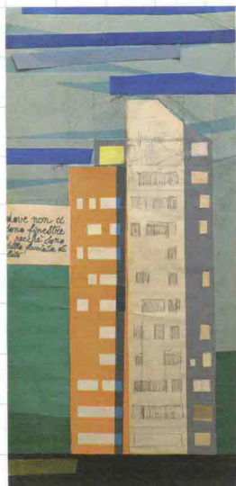
5. Musicaista a cavallo , Cina, Dinastia Tang, tardo 17° secolo; Ben Janssens Oriental Art (benjanssens.com). 6. Lucio Fontana, Concetto spaziale , 1956; Tornabuoni Art (tornabuoniart.fr). 7. Canaletto, Venezia, Piazza San Marco , 18° secolo, Cesare Lampronti (cesarelampronti.it). 8. Giò Ponti, Progetto collage su carta per un edificio , 1971; Rita Fancsaly Gallery (ritafancsaly.com). 9. Giuseppe Maggiolini, coppia di cassettoni con cartigli rappresentanti Bacco e Cerere, 18° secolo; Piva&C (pivaec.it).