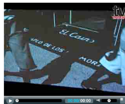
Report - CARLOS GARAICOA, SIN SOLUCION - San Gimignano, Galleria Continua