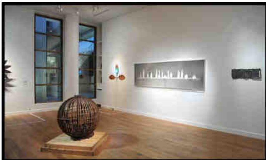
Pier Paolo Calzolari, Sans titre , 27x72x8cm, 1969*****