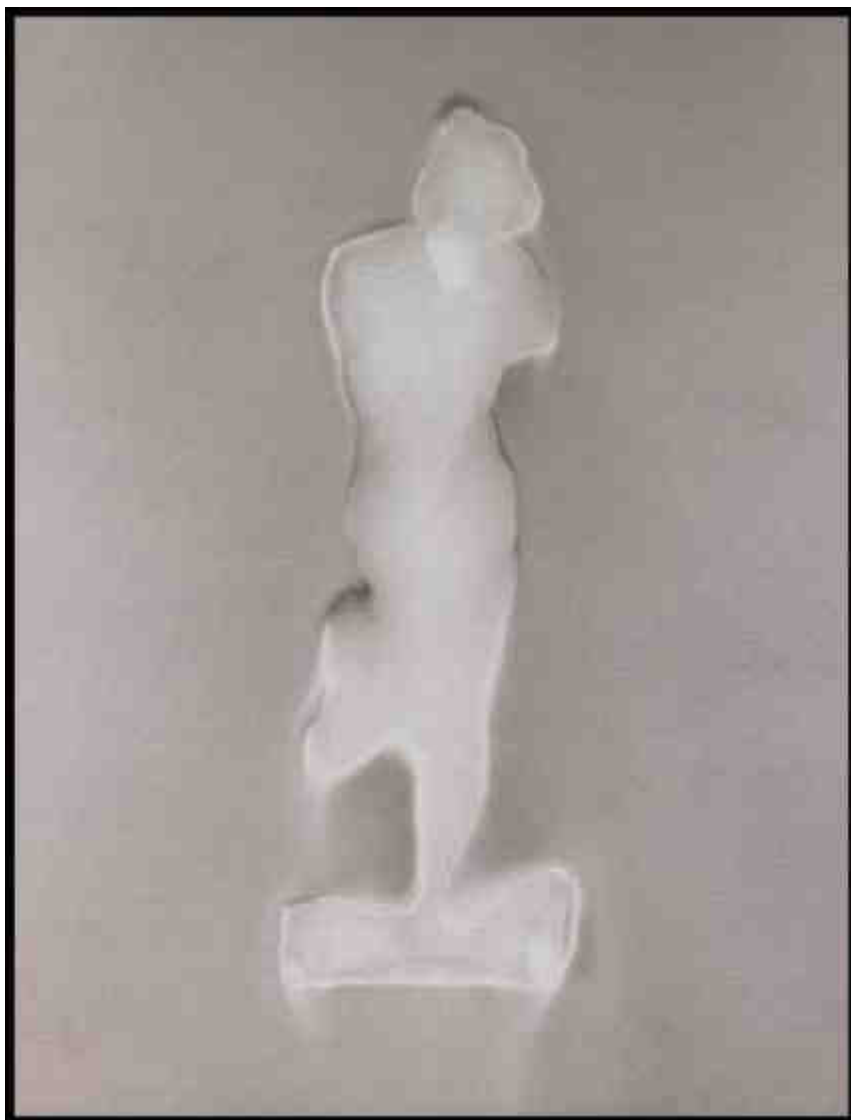
Claudio Pamiggiani, Sans titre , 90x300cm, suie, fumée, bois, 2005****