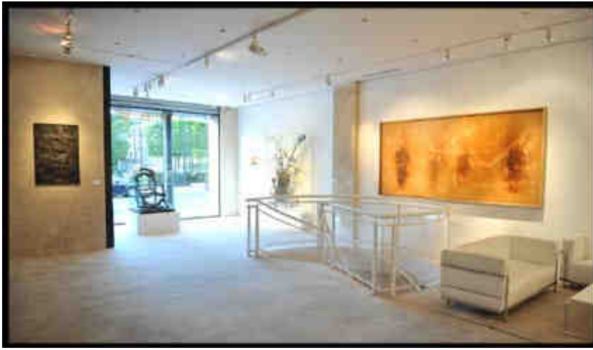
Christian Boltanski , Ombres venues des ténèbres , 1987**