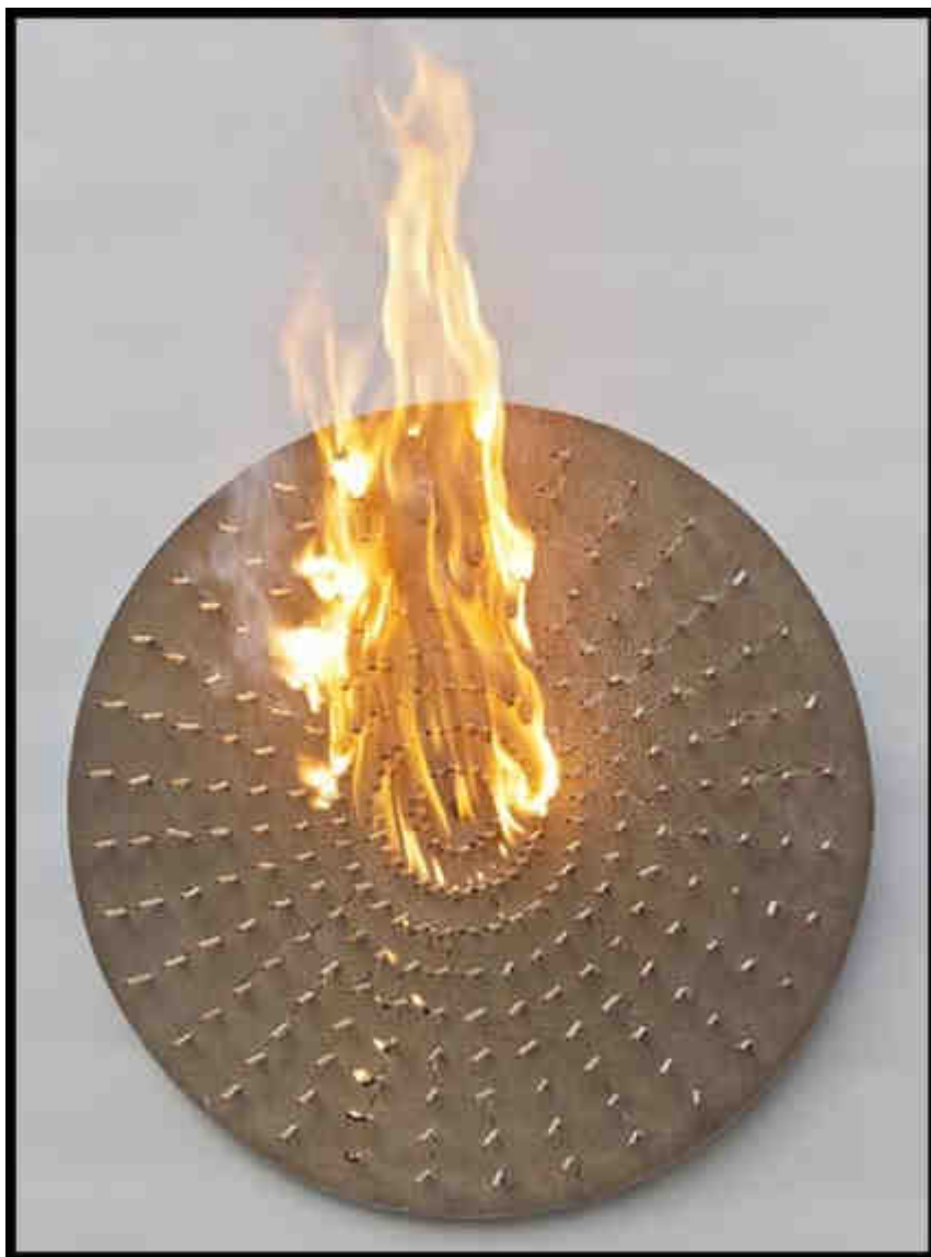
Claudio Pamiggiani, Sans titre , 115x150cm, suie, fumée, bois, 2001****