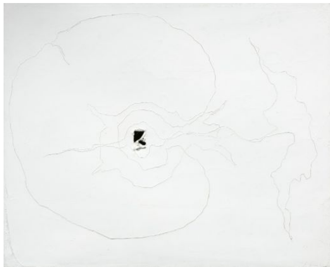
Lucio Fontana Concetto spaziale , 1962 81 x 100 cm, huile, trou et graffiti sur toile

Pour Lucio Fontana, la référence au blanc souligne l'immensité immaculée des espaces expérimentaux à conquérir - la « table rase » - mais aussi la force de synthèse que cette non-couleur symbolise. Les Ambienti spaziali sont, chez Fontana, le lieu de l'expérience par excellence . Il y matérialise ses recherches sur la lumière, ouvrant la voie à l'idée d'art total qui unit peinture, sculpture, architecture et design, notion qui marquera la jeune génération d'artistes qui entre en scène à partir du milieu des années 50, en quête d'une aventure artistique, spirituelle et intellectuelle.