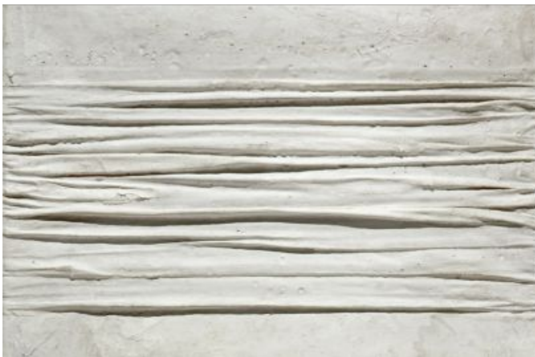
Piero Manzoni, Achrome , 1958-59, 30x40 cm, Kaolin sur toile plissée

Commissaire d'exposition : Dominique Stella