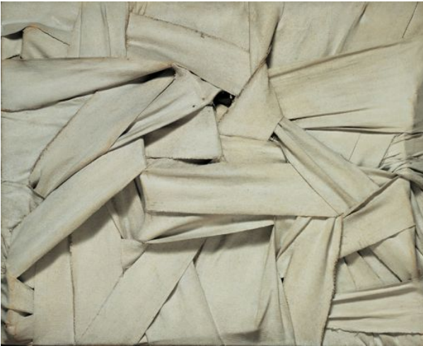
Salvatore Scarpitta, Sans titre , 1958, Bandes et technique mixte, 66 x 81 cm