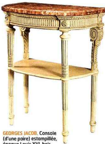
GEORGES JACOB, Console (d'une paire) estampillée, époque Louis XVI, bois sculpté, laqué, 86 x 73 x 40 cm, galerie François Léage.

« L'Art et la Musique » est le thème proposé cette année, suivi stricto sensu par certains, comme la galerie Nichido avec les œuvres du Japonais Suyama, ou Applicat-Prazan qui a sélectionné Concerto n°2 de Serge Charchoune, dont la musique était la principale source d'inspiration. On retrouve le thème dans le Marguerite et Méphisto que Philippe Mendes présente dans sa nouvelle galerie dédiée au XIX e siècle, et dans nombre de tableaux anciens ou modernes, voire les marqueteries de certains meubles. Une soixantaine de galeries sont de la fête. Parmi elles, quelques nouveaux comme les galeries Kamel Mennour et Marciano Contemporary, installées l'une et l'autre avenue Matignon, signe de la présence toujours plus affirmée dans le quartier de la création contemporaine par rapport aux galeries d'art classique. Au nombre des nouveaux, il faut aussi citer des sociétés de ventes aux enchères: Piasa, Audap-Mirabaud, Kohn, qui profitent de l'événement pour présenter leurs prochaines ventes. Au fil des galeries, on découvre une trentaine d'expositions thématiques ou personnelles. Au hasard: les estampages de stèles chez Françoise Livinec,