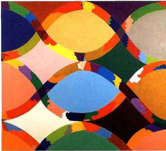
PIERO DORAZIO, Ideal II , 1968, huile sur toile, 150 x 170 cm, galerie Tornabuoni.