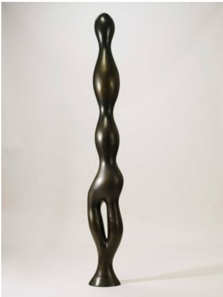
Torse (Stèle) , de Jean (Hans) Arp, 1963, bronze, 198 x 22 x 28 cm (Landau Fine Art Gallery).