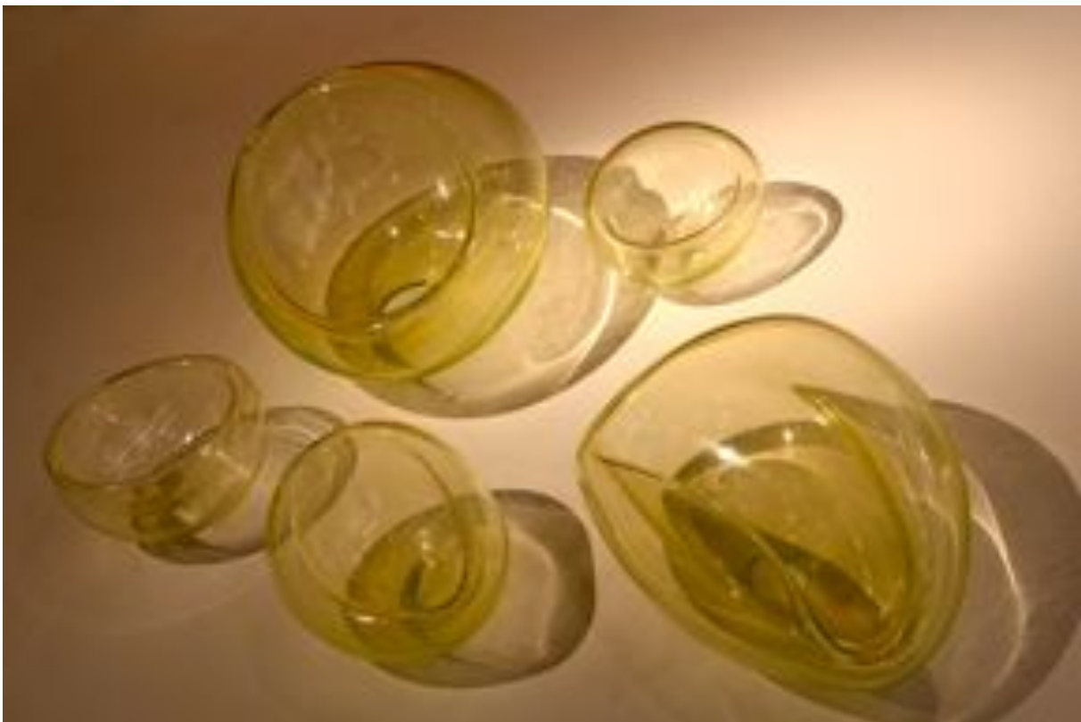
Vases , de Piotr Kowalski, 1989, verre soufflé. Pièces uniques réalisées au CIRVA © Alain Potignon (Galerie Downtown).

TEFAF, Maastricht du 15 au 24 mars 2013. www.tefaf.com