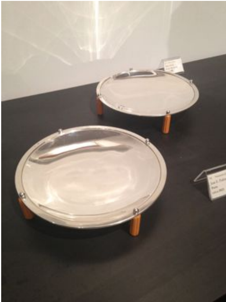
Présentoirs , de Jean Puiforcat, vers 1923 (Francis Janssens van der Maelen).