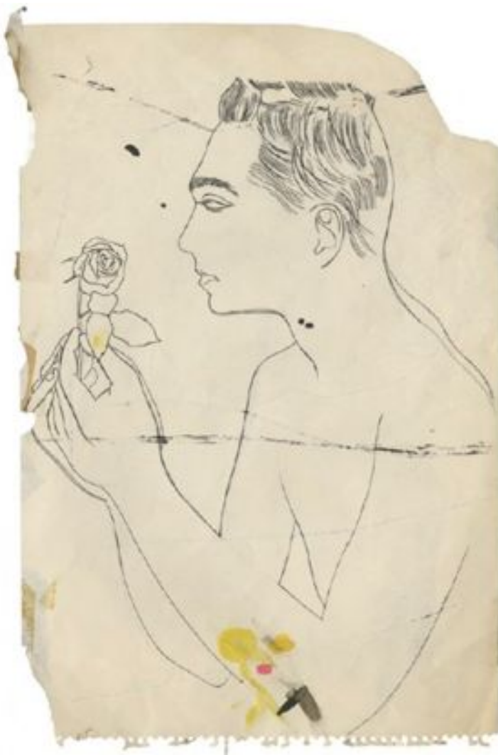
Male Upper Torso Holding Rose , d'Andy Warhol, 1956, encre et graphite sur papier (Galerie Daniel Blau).