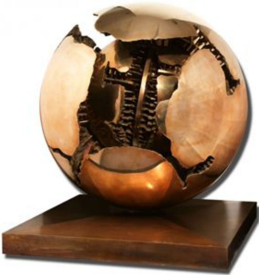
Sfere , d'Arnaldo Pomodoro (Galerie Tornabuoni).