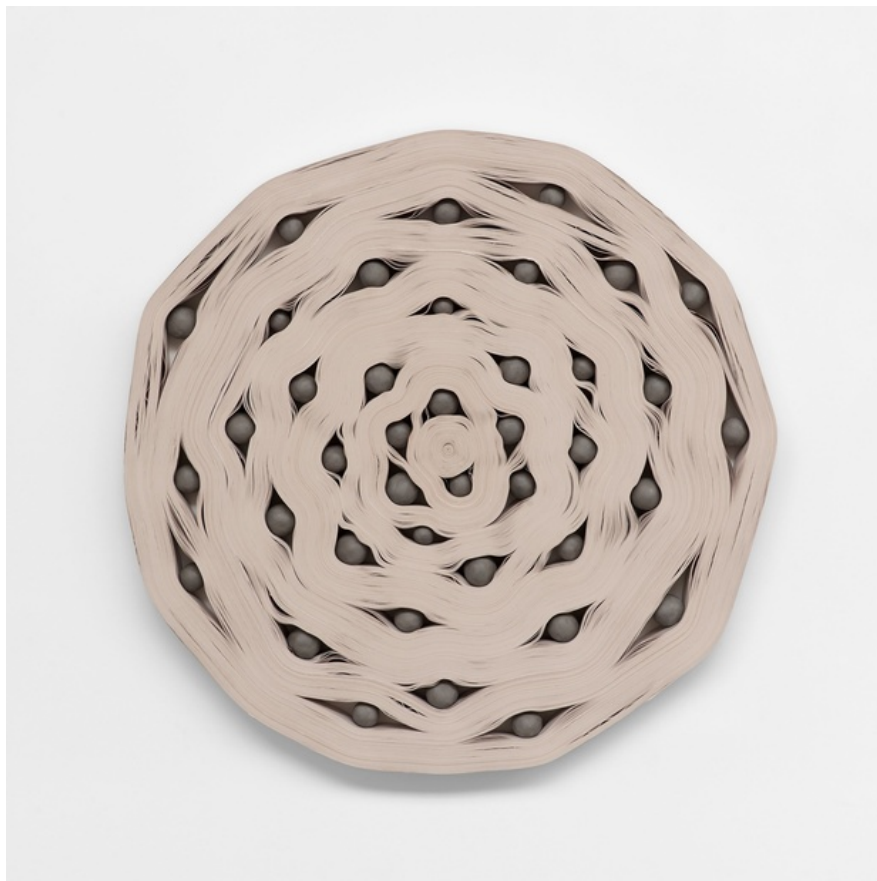
Michel François, Enroulement, 2016