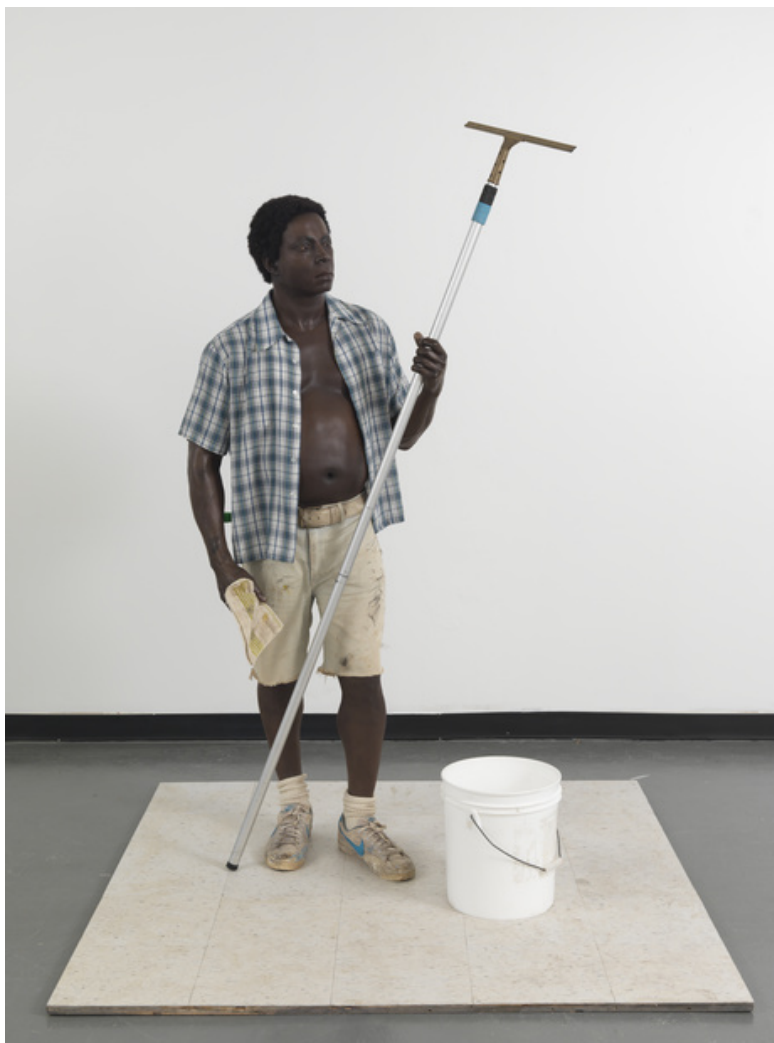
Duane Hanson, Window Washer, 1984