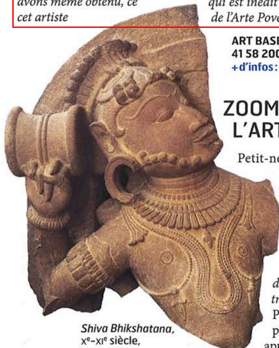
Shiva Bhikshatana, X e -XI e siècle, grès rose, H. 38 cm (GALERIE HIOCO, PARIS).