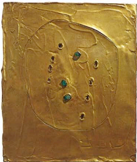
Lucio Fontana, Concetto Spaziale , 1961, huile, graphite, verre sur toile, 45 x 38 cm (COURTESY DE L'ARTISTE ET DE LA GALERIE SPERONE WESTWATER, NEW YORK).