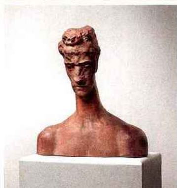
Wilhelm Lehmbruck (1881-1919), Head of a Rising Youth, ca. 1914, pierre reconstituée, 54 x 51 x 20 cm.

Louis Soutter (1871-1942), Carnaval , 1939, huile sur papier, 50 x 65 cm. Courtesy Galerie Karsten Greve, Paris.