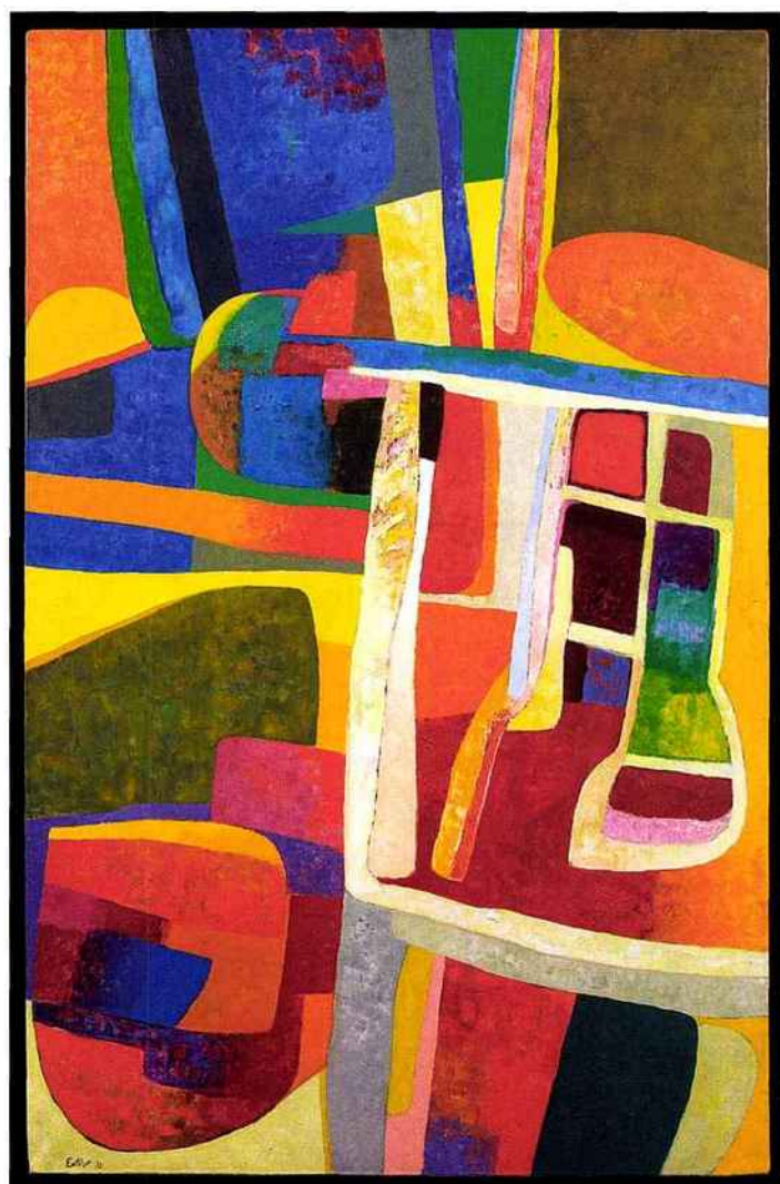
Maurice Estève, Trigourec , 1972, huile sur toile, 146 x 97 cm.

Dans un marché de l'art de plus en plus ébranlé par la crise, l'art moderne redevient la valeur la plus sûre auprès des collectionneurs... et de la Fiac, qui s'appuie sur son histoire et sa géographie pour hisser les voiles !