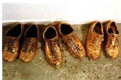
En noir et blanc ou multicolore (comme ce Jim Dine, chez Templon) ? À la fin de la journée, même les chaussures de métal (de Ry Rocklen, chez Praz-Delavallade) étaient usées...

écœuré, parfois se plaindre d'être moqué, maltraité ! Pour constater amèrement que des valeurs pseudo-bourgeoises ainsi piétinées n'étaient en fait que nouvelles valeurs culturelles bourgeoises. Pour comprendre pourquoi tous ces collectionneurs riches et ces nouveaux ploutocrates acculturés, pourquoi cet univers si éloigné et pourtant si proche engloutit des fortunes dans un tourbillon, où, à l'occasion, le mauvais goût se mélange en ingrédient d'une spéculation artistique débridée.