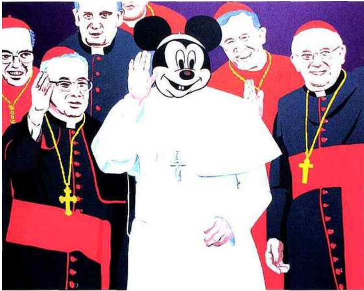
Bernard Rancillac, Destination Sixtine, 2013, acrylique sur toile, 60,5 x 91,5 cm. © Rancillac. Courtesy galerie Lélia Mordoch, Paris.