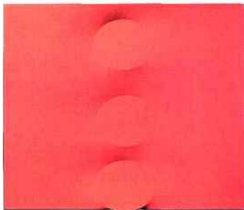
Turi Simeti, Tre ovali rossi, 2014, acrylique sur toile extroflexe, 100 x 120 cm.

◆ « Bernard Rancillac. Encore lui », galerie Lélia Mordoch, 50, rue Mazarine, Paris-6° ; www.letiamordochgalerie.com