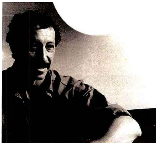
Turi Simeti lors de son private show à New York en 1968.

16 Avenue Maignon, 75008 Paris Heures d'ouverture : du lundi au samedi, 10h30 - 18h30