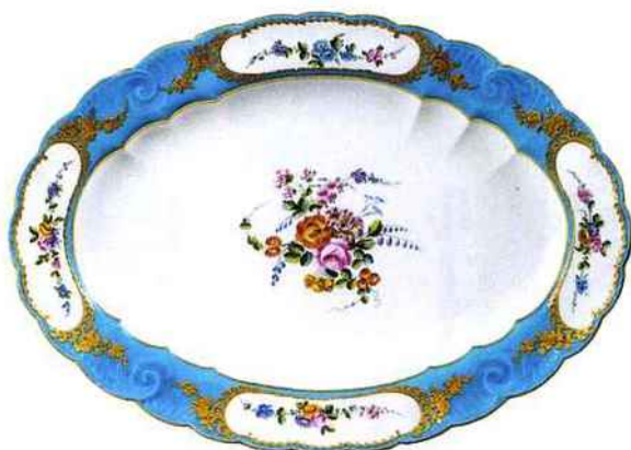
Plat du service "Bleu Céleste" initialement livré à Versailles pour l'usage du roi Louis XV, XVIII e siècle.

"Royal and Imperial Sèvres porcelain", du 18 juin au 2 juillet 2014 à la galerie Mackinnon, 5 Ryder Street, St James's, Londres. Ouvert de 11h à 17h. Tél. 00 44 20 78 39 56 71. www.mackinnonfineart.com