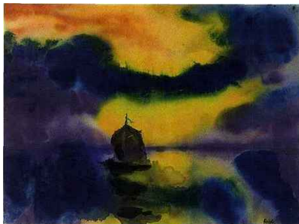
Emil Nolde, Mer, soleil couchant et bateau à voiles , 1930. Aquarelle, 37 x 45 cm. Photo service de presse. © Galerie Malingue

"Peintres caravagesques italiens, peintres de la réalité", jusqu'au 12 juillet 2013 à la galerie Sarti, 137 rue du Faubourg Saint-Honoré, 75008 Paris. Ouvert du lundi au vendredi de 9h30 à 13h et de 14h à 18h30. Tél. 01 42 89 33 66. www.sarti-gallery.com