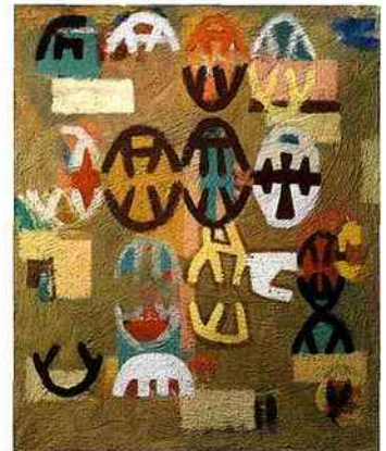
Giuseppe Capogrossi, Superficie, 1953-1971, huile sur toile, 60 x 50 cm.

La galerie Tornabuoni présente une trentaine d'œuvres (de 50 000 € à 700 000 €) de Giuseppe Capogrossi (1900-1972). Ces pièces majeures ont été exposées récemment à Venise lors de l'importante rétrospective organisée par la Peggy Guggenheim Collection à l'occasion du 40 e anniversaire de la disparition du peintre. L'exposition parisienne retrace la dernière période de la production de