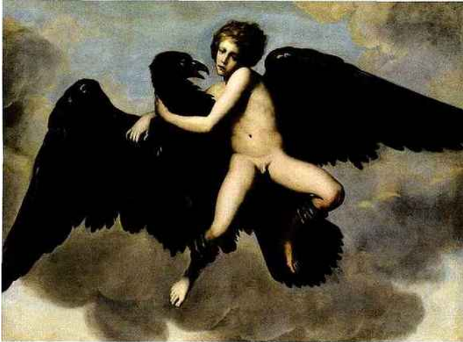
Peintre toscan (?) actif à Rome, L'Enlèvement de Ganymède, v. 1615-1620, huile sur toile, 150,5 x 214 cm.