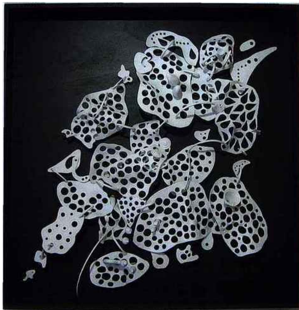
Catherine Névin, Tissons des liens , porcelaine. © Galerie Tokonoma Photo : Jean Bernard Pordon