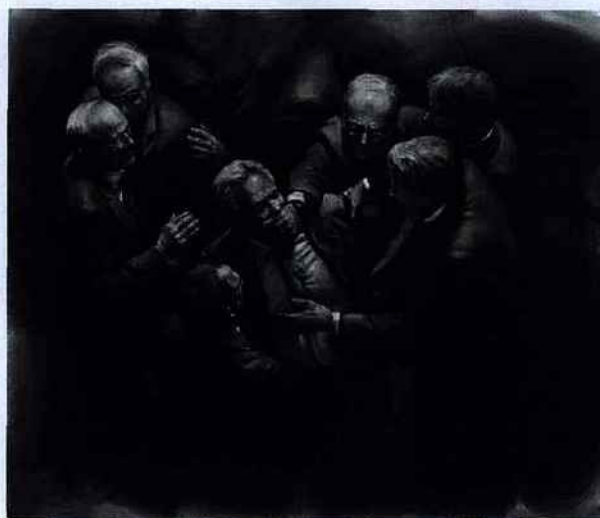
Mircea Suci, We the people , 2012.

"Art Paris Art Fair" du 28 mars au 1 er avril 2013. Grand Palais. www.artparis.fr