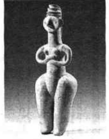
Grande idole de Kaluraz en terre cuite. Début du 1 er millénaire avant J.C.

GRAND PALAIS. Vitrine parisienne des arts décoratifs du monde entier, la Biennale des antiquaires qui s'est ouverte ce week-end sous la nef du Grand Palais rassemble les plus beaux objets d'antiquité qu'on puisse trouver depuis la nuit des temps jusqu'à nos jours. Ce paradis raffiné des amateurs d'art et des collectionneurs a été mis en scène, cette année, par Karl Lagerfeld.