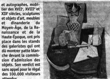
Vase pipe nuant de tabac. Picasso. TORNABUONI ART.