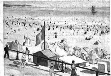
Albert Marquet. La plage des Sables-d'Olonne. 1923. Galerie de La Présidence.