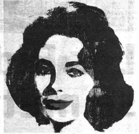
Liz. Andy Warhol. L & M Arts.