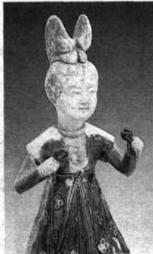
Dame de cour assise. Galerie Christian Deydier.

Les milliers d'objets, de meubles, de tableaux, de bijoux que dévoilent quelque cent vingt-deux antiquaires triés sur le volet parmi les plus prestigieux au monde ont été sublimes cette fois dans un décor signé Karl Lagerfeld. Une griffe qui ajoute encore à la magnificence, à la précision de la XXVI e édition de la Biennale des antiquaires qui vient d'ouvrir ses portes sous la nef du Grand Palais et dans le salon d'honneur à nouveau accessible après des années de restauration. Grand collectionneur et amateur d'art et de beau en général, le couturier a relevé le défi et imaginé un écrin conçu comme s'il devait accueillir les plus belles des collections de haute couture. Dans ce musée d'exception, pendant une semaine seulement, le monde de l'antiquité met ses trésors au jour. Pièces uniques de joaillerie, de reture, de terre cuite ou de peinture, objets de la préhistoire ou œuvre de Picasso, s'offrent aux regards de part et d'autre d'une allée centrale qui symbolise pour le scénographe, la plus belle avenue du monde avec une reconstitution spectaculaire de l'Arc de Triomphe et de l'Obélisque de la Concorde. A l'image des galeries marchandes parisiennes du XIX e siècle, sur plus de cinq mille mètres carrés, les stands rivalisent de raffinement et d'élégance.