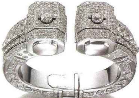
Bracelet en platine et diamants réalisé par la maison Cartier en 1934, la fin de la période Art déco étant marquée par un retour au « tout blanc ». Siegelson.