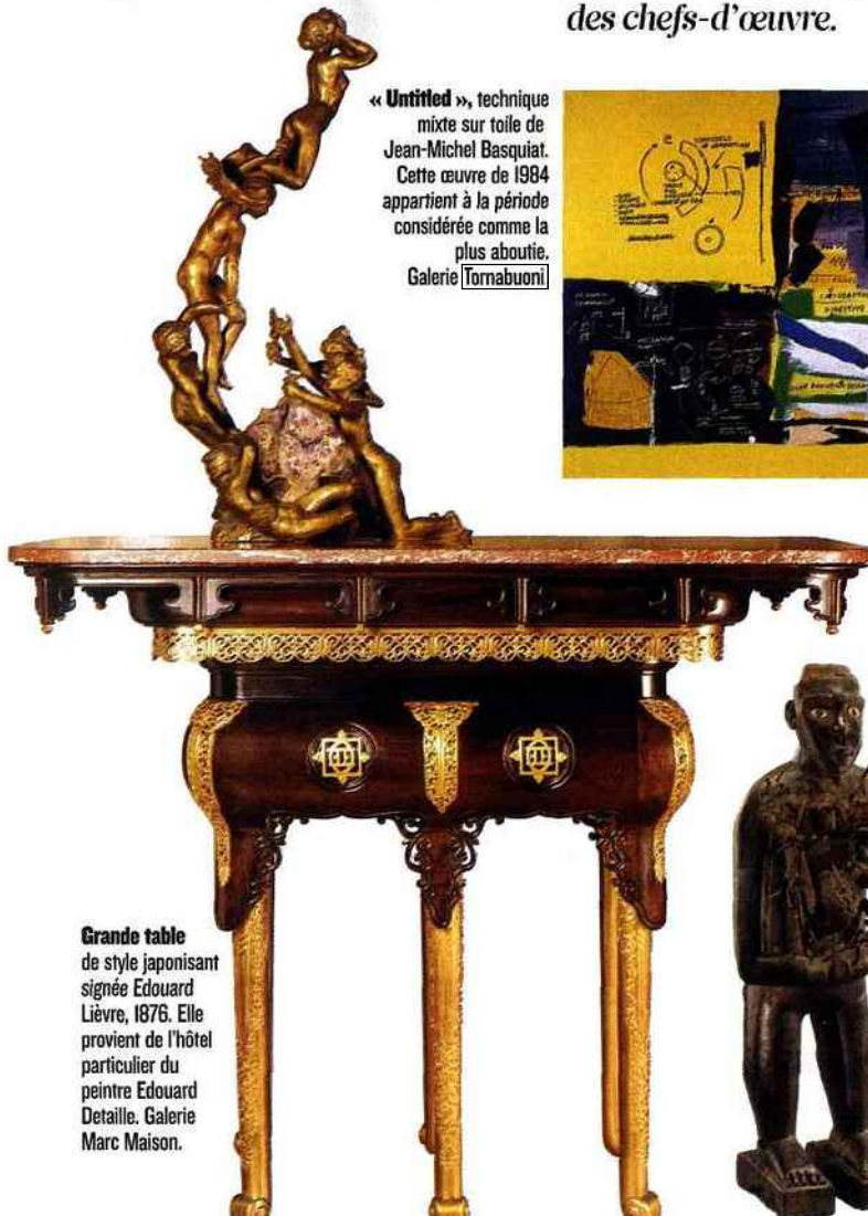
Grande table de style japonisant signée Edouard Lièvre, 1876. Elle provient de l'hôtel particulier du peintre Edouard Detaille. Galerie Marc Maison.

Grand fétiche à clous Kongo provenant de l'ancienne collection James Hooper, l'une des rares pièces de cette taille encore en mains privées. H. 85,5 cm. Galerie Didier Claes.