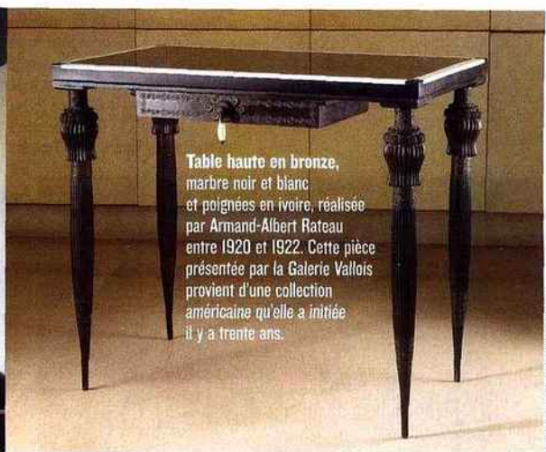
Table haute en bronze , marbre noir et blanc et poignées en ivoire, réalisée par Armand-Albert Rateau entre 1920 et 1922. Cette pièce présentée par la Galerie Vallois provient d'une collection américaine qu'elle a initiée il y a trente ans.