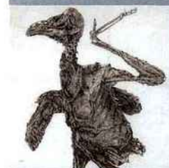
Sacha Ketoff, CHOUETTE MOMIFIÉE , 2011, mine, sépia sur papier paraffiné.