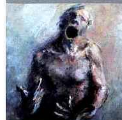
Sereirrof, ÉCOUTEZ MOI 2 (détail), 2011, huile sur toile.