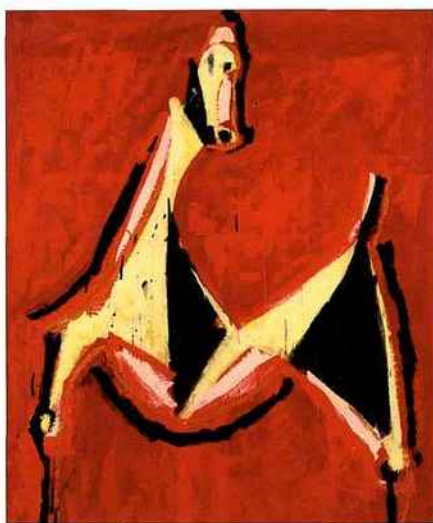
Marino Marini, CAVALLO ROSSO (détail), 1953, huile sur papier maroufflé.