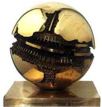
Arnaldo Pomodoro, Sfera , 1990, bronze, Ø 50 cm (TORNABUONI ART, PARIS).

Pomodoro est surtout connu pour ses sphères de bronze brillantes dont la fracture tellurique et l'éclatement laissent apparaître un univers abstrait construit. Ses œuvres monumentales installées dans des lieux publics à travers le monde, comme au siège de l'Unesco à Paris ou à l'Exposition universelle de Shanghai, où il présentait une pièce de dix mètres de haut pour le Pavillon italien, lui ont donné une dimension internationale. Arnaldo Pomodoro ouvre même en 1999 sa Fondation à Milan, dans une ancienne fabrique de turbines hydrauliques. Allant au-delà de cette image d'artiste « officiel », la galerie Tornabuoni