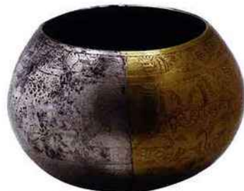
Bol cérémoniel, culture Chimú (900-1470 apr. J C) Or et argent Laminé/Ciselé/Soudé 82 x 117 x 117 mm Musée Larco, Lima