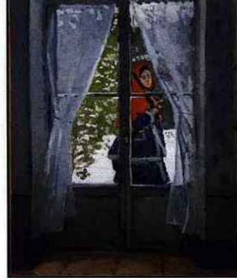
La Capeline rouge, portrait de Madame Monet, 1873, huile sur toile, 99 x 79,8, The Cleveland Museum of Art, Etats-Unis

16 avenue Matignon - 75008 Paris (métro: Franklin Roosevelt, Saint-Philippe du Roule) www.tornabuoniart.fr