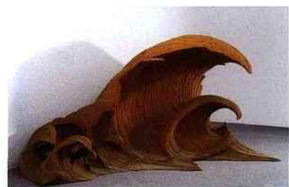
Vague, 175 x 390 x 200 cm, 1992