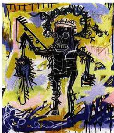
Untitled, 1981, acrylique, pastel gras et peinture à l'aérosol sur toile, 198 x 173 cm, Collection Mia et Patrick Demarchelier © The Estate of Jean-Michel Basquiat © ADAGP, Paris 2010

© ADAGP Paris 2010, photo Ph. Migeat Collection Centre Pompidou, Dist. RMN