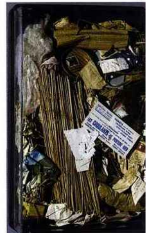
Arman, Poubelle des Halles, 1961

© ADAGP Paris 2010, photo Ph. Migeat Collection Centre Pompidou, Dist. RMN