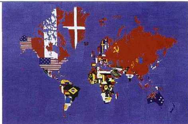
ALIGHIERO BOETTI, « MAPPA », 1975-1985.

Rétrospective Alighiero Boetti, jusqu'au 10 juin, Tornabuoni Art, 16, avenue Matignon, Paris VIII e , tél. : 01 53 53 51 51, www.tornabuoniart.fr