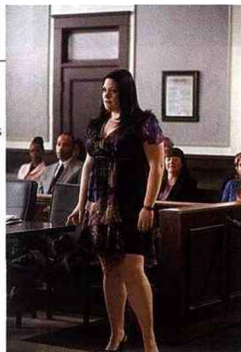
ALIGHIERO BOETTI

Drop Dead Diva , avec Brooke Elliott, à 20h35 sur Téva.