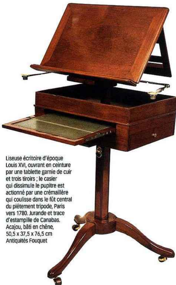
Liseuse écrivain d'époque Louis XVI, ouvrant en ceinture par une tablette garnie de cuir et trois tiroirs; le casier qui dissimule le pupitre est actionné par une crémaillère qui coulisse dans le fût central du piétement tripode, Paris vers 1780. Jurande et trace d'estampille de Canabas. Acajou, bâti en chêne, 50,5 x 37,5 x 76,5 cm Antiquités Fouquet

14 e édition de la Nocturne rive droite (sous l'égide de l'association Prestige Matignon), le 2 juin 2010 de 17 h à 23 h. www.art-rivedroite.com