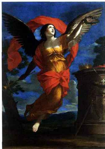
Giovanni Francesco Romanelli (1612-1662), La Renommée . H/T, 191 x 137,5 cm Galerie Maurizio Nobile

Le 2 juin prochain, les galeries et antiquaires de la rive droite, regroupés autour de l'avenue Matignon et des rues du Faubourg-Saint-Honoré, de Miromesnil, de Penthièvre et La Boétie, organisent la quatorzième édition de leur nocturne. Flânerie dans un quartier où s'implantent de plus en plus de grandes galeries d'art contemporain aux côtés des galeries classiques d'antiquité.