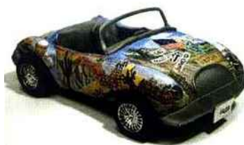
Broderie de Cindy Hickok