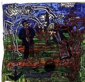
Barbizon - Robert Combas