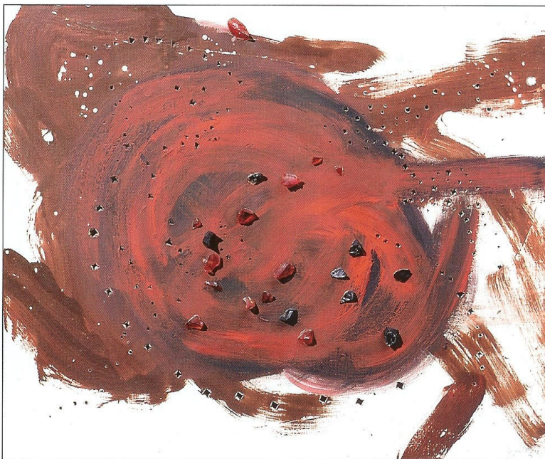
Lucio Fontana, Concetto spaziale , 1953. Huile et verre sur toile, 60 x 70 cm.

"Lucio Fontana, rétrospective, Je pars pour Paris" du 1 er octobre au 10 décembre 2009, à la galerie Tornabuoni, 16 avenue Matignon, 75008 Paris, tél. 01 53 53 51 51. www.tornabuoniart.fr