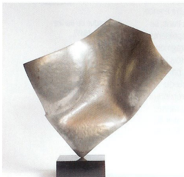
Sergio Storel, Torse-Surface , 1971. Aluminium, 56 x 56 x 16 cm.

de l'athlète, l'expression des visages. Quant à ses sculptures en fil de fer, elles sont des esquisses spontanées qui mettent en scène une monotonie du quotidien. Elles sous-tendent un drame humain, cachent une force vitale. B. B. S. G. "Sergio Storel, paroles et fil de fer" du 6 au 31 octobre 2009, à la galerie Martel-Greiner, 71 boulevard Raspail, 75006 Paris, tél. 01 45 48 13 05. Ouvert du mardi au vendredi de 11 h à 12 h et de 13 h à 19 h ; le samedi de 11 h à 12 h et de 14 h à 19 h.