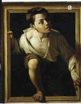
1. E. Hopper, Morning Sun (1952). 2. Pere Borrell del Caso, Fuggendo dalla critica (1874). 3. A. Calder, Pomegranate (1949).